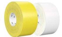
3M™ Ultra Durable 971 traka za označavanje poda